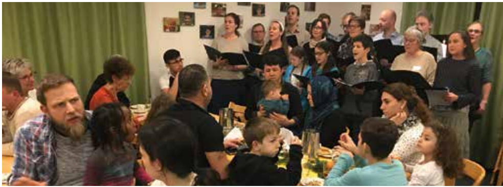
Weihnachtsfeier ÄMTLER TANDEM